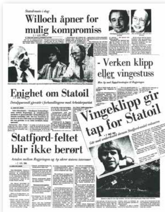
Denne samlingen med avisklipp viser bare en liten del av mediedekningen som vingeklippingen av Statoil fikk.

Disse forslagene konsentrerte seg om Statoils rammebetingelser: Ved å kanalisere hovedtyngden av pengestrømmen direkte inn i statskassen, ville «problemet» med kapitalopphopning i statsoljeselskapet bli unngått. Ved å endre stemmereglene ble samtidig spillereglene endret i beslutningsprosessen i de enkelte lisensene.