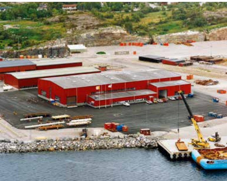
Lagerhallen til Shell og Draugen på Vestbase.

Først 30. mars 1979 var etablering av oljebasen i Vikan – «Vestbase» formelt vedtatt i bystyret. I mai 1979 kom endelig klarsignalet for boring nord for 62. breddegrad. Frist for å søke konsesjon ble satt til 1. august 1979, med oppstart i mai 1980.