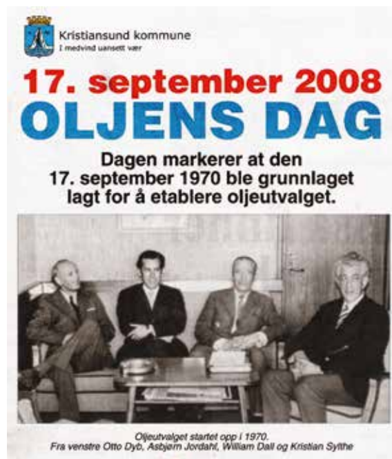
Kristiansund kommune reklamerer for Oljens dag i Tidens Krav 15. september 2008

Byens politikere begynte å jobbe med tanken om at Kristiansund kunne bli en oljeby allerede i 1970. Dette kulminerte på et møte i