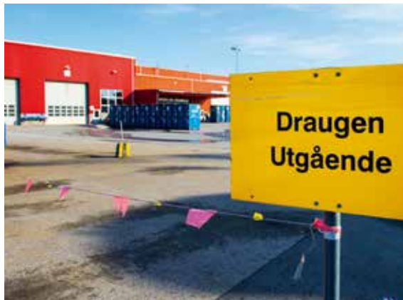
Forsyning fra Vestbase til Draugen.

Februar 1990 sikret Vestbase seg transportkontrakten i forbindelse med utbyggingen av Draugen-feltet. «Den hittil