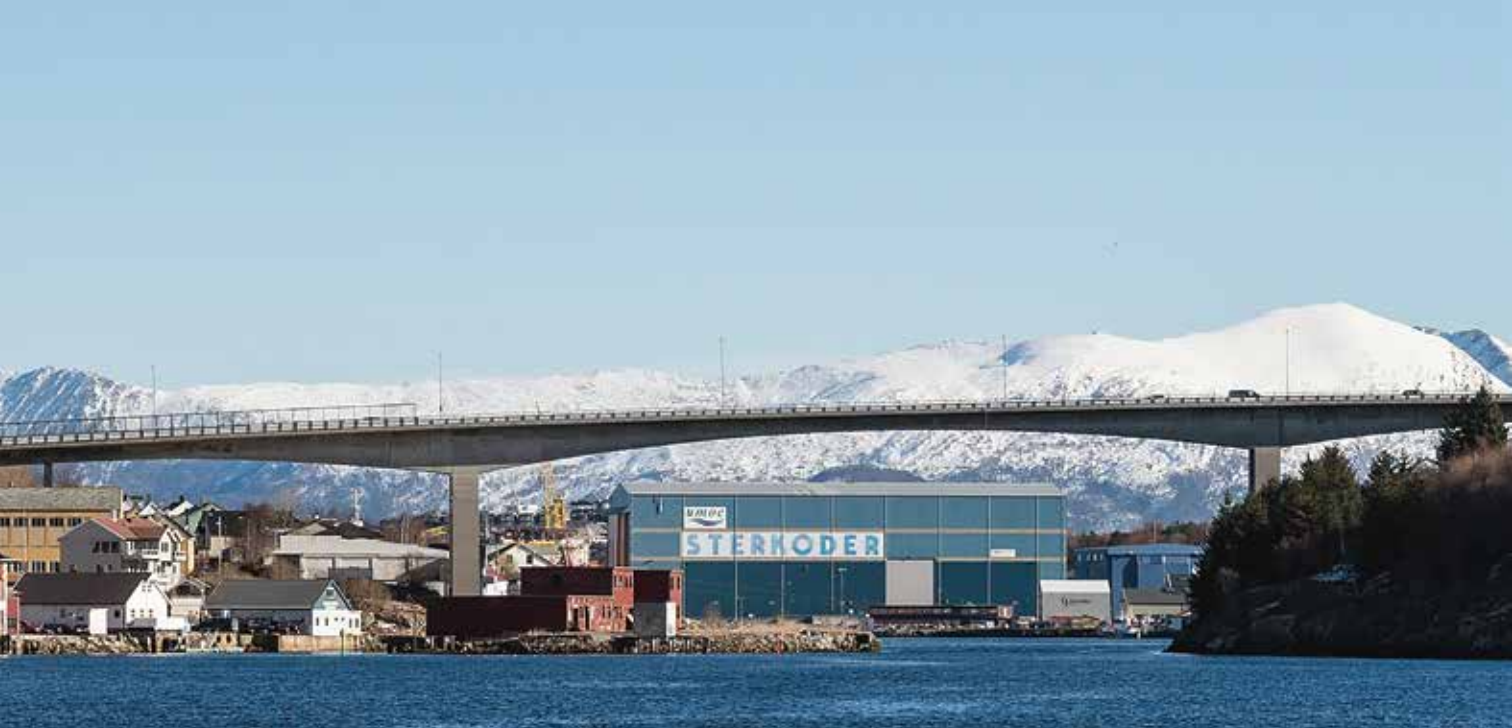
Sterkoder.