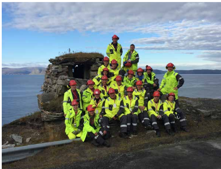
Alle ansatte på NOM samlet på Melkøya.

I Alta stod også severdighetene i kø; Alta museum og helleristningsfeltet, Pæskatun skiferbrudd og tur til Alta kraftverk og demningen i Sautso var blant ingrediensene. Årets studietur føyer seg altså inn i rekken av vellykkede studieturer med både faglig påfyll og sosialt samvær.