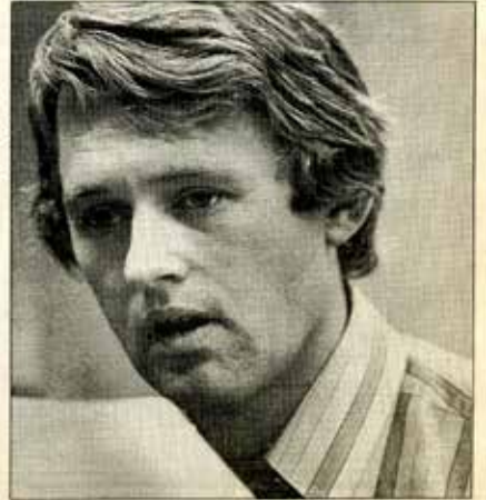
— De streikende oppnådde lønner på norsk nivå halvannet år før de gikk ut i kon-

Spørsmålene om nattlegg og overtidstillegg gikk de streikende med på å skulle bringes inn for frivillig voldgift. Brown & Root foreslo dette lenge før streiken ble avslått. Også spørsmålet om betaling under streiken skal inn for voldgift. Men det har ennå ikke skjedd at streikende har fått betaling for å streike i Norge. Kravet om å få tilbakebetalt skatt ble oppgjitt. De