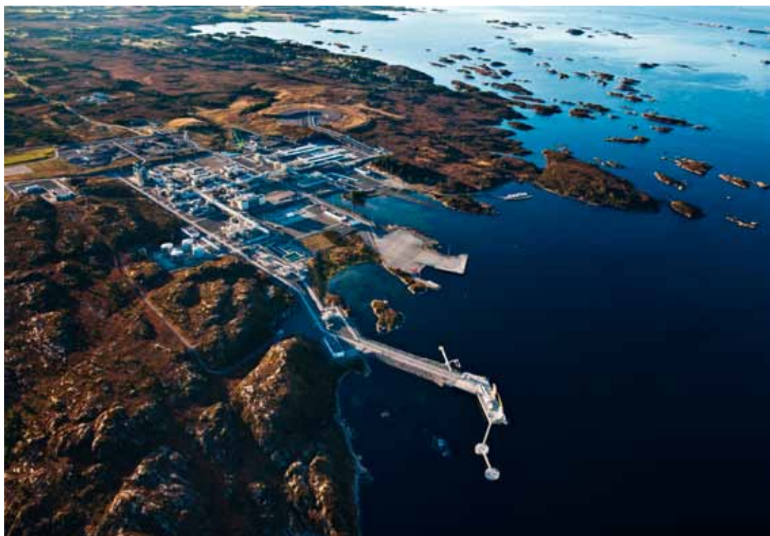
Nyhamna i Aukra kommune på Romsdalskysten er Midt-Norges knutepunkt for gassseksport. Her vil det skje mye i årene fremover når nye gassrør kommer fra nord.

ble et slagord som vant frem i de politiske miljøene. Hydro ville i land på Romsdalskysten!