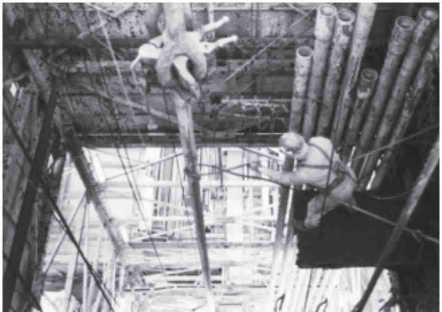
Tårnmann i arbeid. Tøff jobb på liten plattform med arbeids- høyde 30 meter ned til boredekk.

Historien om starten på det norske oljeeventyret er fortellingen om barske menn som tar livsfarlige sjanser, om heltemot på grensen til det dumdristige, det er fortellingen om lovløse tilstander og et beinhardt arbeidsmiljø uten tanke på helse, miljø og sikkerhet, Og det er fortellingen om en ung iraker som ble Norges viktigste oljebyråkrat mens han ventet på nattoget til Åndalsnes.