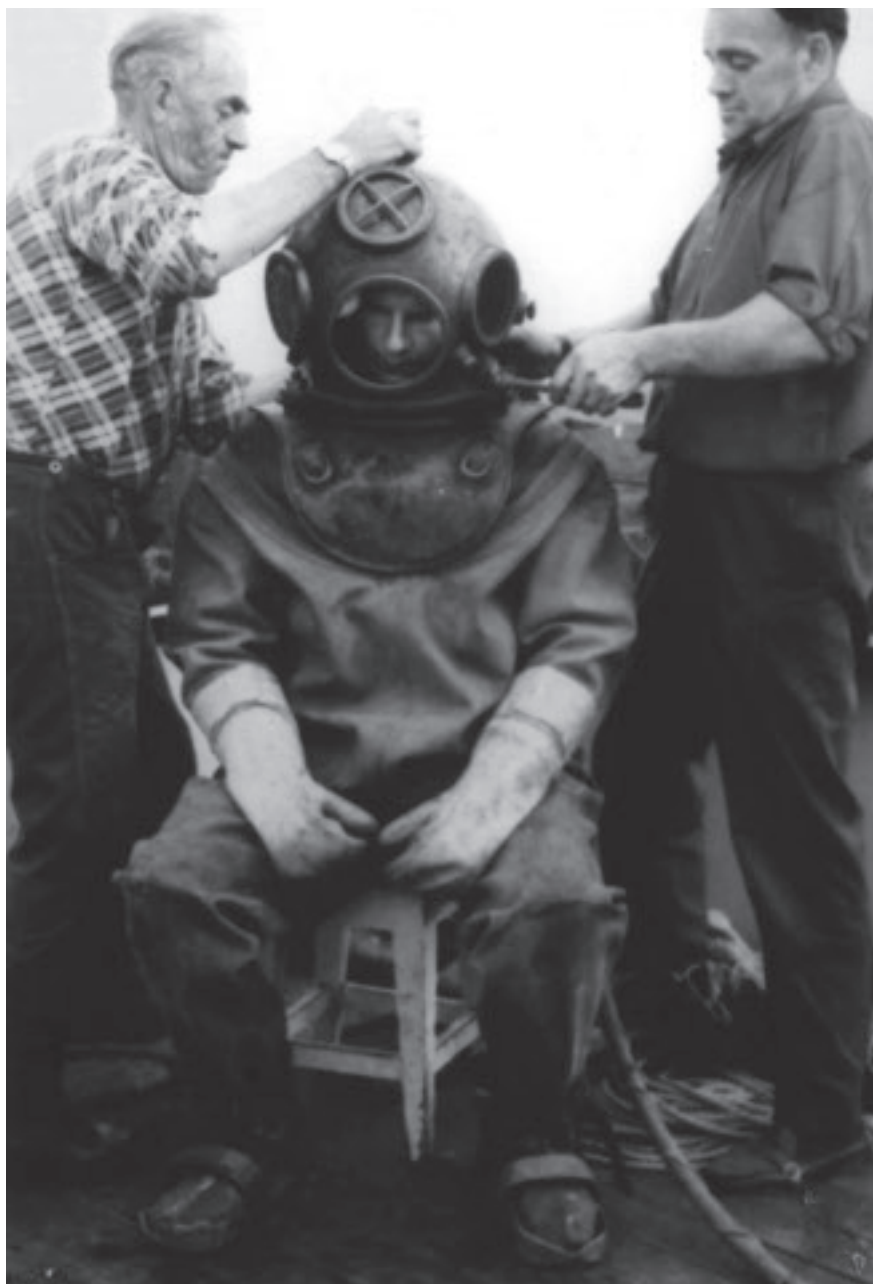
Dykkeren blir ikledd drakt og hjelm og er så klar for jobben. Bildet er fra 1967

ble sendt rundt, folk kunne bestille det de ønsket. Varene ble levert, under transporten hjem ringte pilotene til land og spurte om kysten var klar.