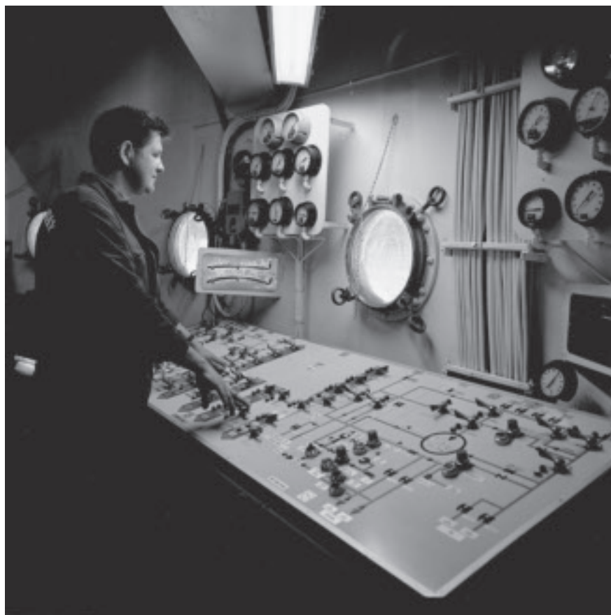
Kontrollrom på «Ocean Traveler».