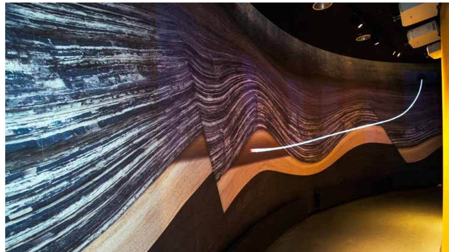
Det geologiske profilet er over 11 meter langt og 3 meter høyt. Den animerte borestrengen projiseres på profilet ved hjelp av seks projektorer.

Å bore veldig lange hull i bakken under sjøbunnen på jakt etter olje og gass er ganske utfordrende. Har du lurt på hvordan det gjøres? Da må du gjøre deg klar til å få følge med boret fra boreriggen, ned gjennom ulike bergarter, forbi forkastninger og store folder i berggrunnen – på jakt etter oljereservoaret. Nå har du nemlig muligheten til å få oppleve dette i en helt ny utstilling. Ved hjelp av en AV-teknisk avansert opplevelse – med et stort geologisk profil og en animert borestreng, tar vi deg med ned i berggrunnen langt under havbunnen, viser deg hvilke geologiske lag det kan finnes olje og gass i og hvordan et olje- og gassreservoar kan se ut. Målet er å gi våre besøkende en innføring i hovedprinsippene i moderne boreteknologi og grunnleggende forståelse av petroleumsgesologiske prinsipper.