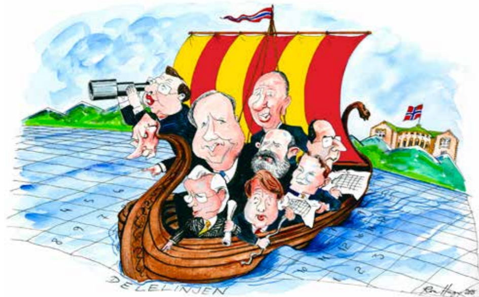
«Oljeveteranene» har en sentral plass i «Samboer med oljå 1965-2015».