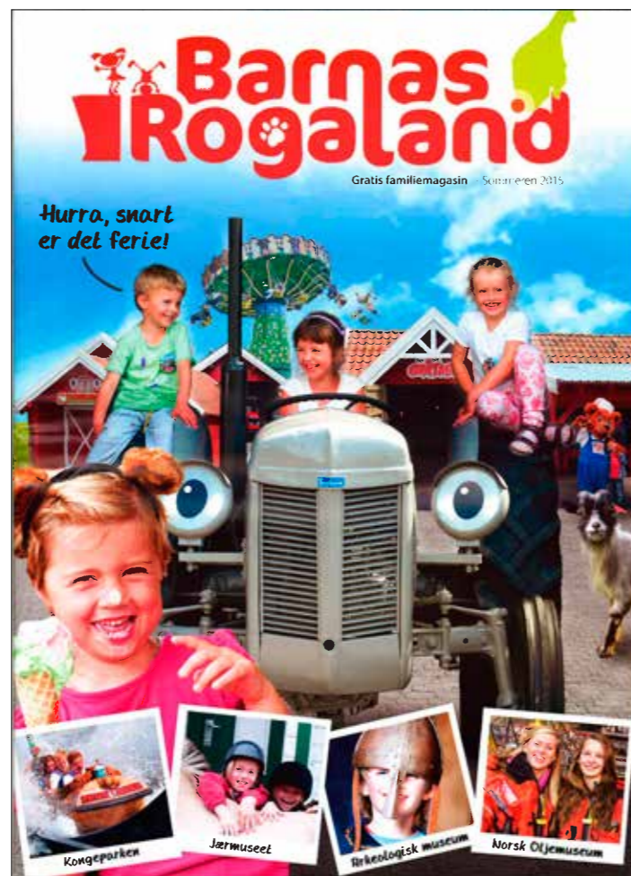
Magasinet «Barnas Rogaland»

Vi er meget godt fornøyd med resultatet – og har selv fått en god påminnelse om hvor mange kjekke aktiviteter som tilbys i Rogaland!