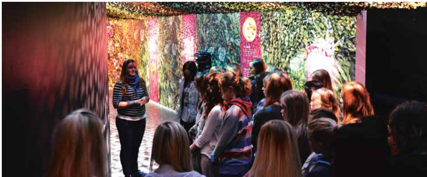
Jentene blir tatt med på omvisning i utstillingen om apejenta Ida.

Klokken er like over ni, fredag 27. april, og museet er i ferd med å fylles opp av forventningsfulle unge jenter.