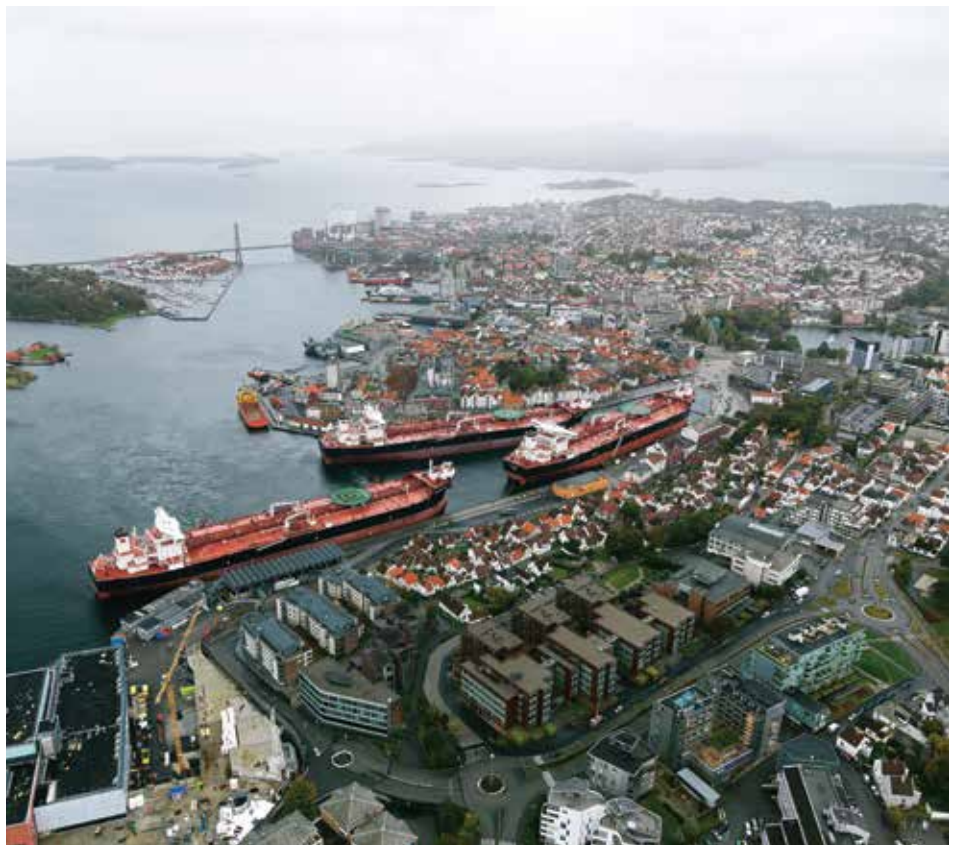
Trangt i Vågen under dåpen av de tre søsterskipene. “Nansen Spirit” til venstre.

Skipene i Amundsenklassen er, i følge rederiet sely, de mest sofistikerte og miljøvennlige shuttle tankerne som noen gang er bygd. Lavt bunkersforbruk, lave utslipp og redusert fare for sprekker i skrog- og dekkstrukturene er noen av fordelene denne klassen av skip har. De er også klargjort for å operere i kalde farvann, blant annet gjennom oppvarming av ballastvann.