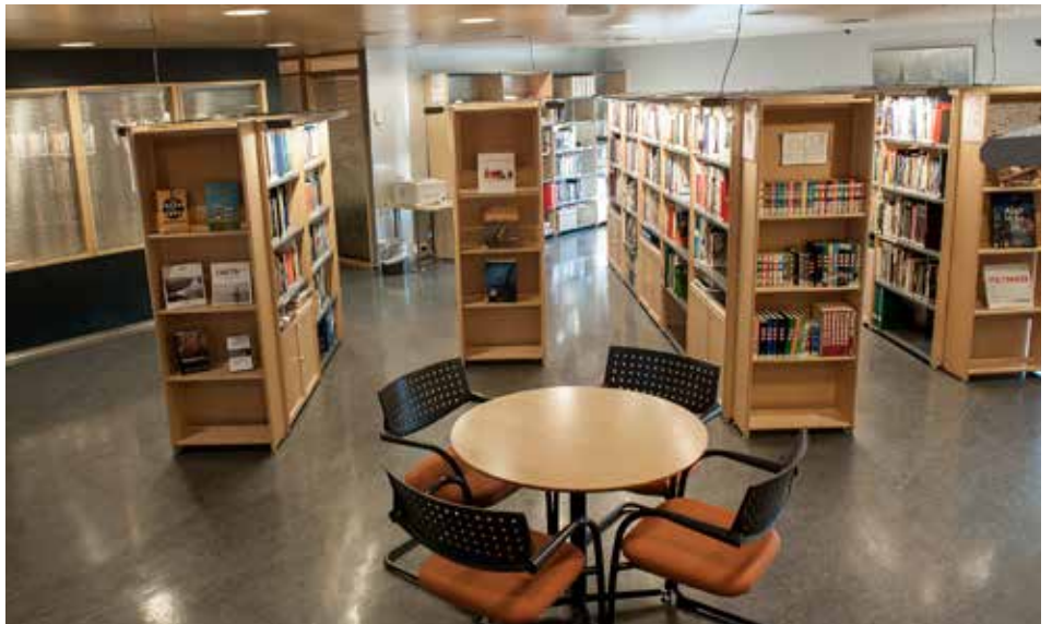
Oversiktsbilde over biblioteket.

Oljemuseets bibliotek har gjennomgått en liten endring og oppgradering i løpet av våren. Etter at vi sluttet å gjennomføre spillet «Kampen om Herkules», er de gamle datastasjonene blitt fjernet. Dette har gitt oss større plass til bøker, men det har også gitt oss mulighet til å arrangere undervisning for små grupper.