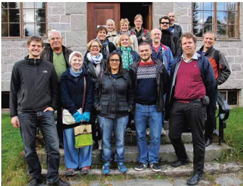
Gjengen samlet foran steinbygningen i granitt fra 1939 på Glomdalsmuseet - hvor vi fikk en historisk oversikt over militærhistorien og krigshistorien i Hedmark, med de nasjonale og internasjonale forhold som bakteppe.

og møte museumskolleger fra andre deler av landet. Det ble noen travle og informative dager med nye impulser til egen virksomhet i oljebyen.