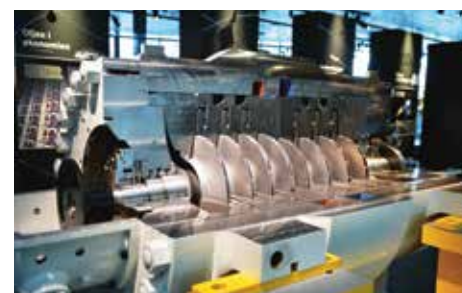
Gasskompressoren ruver i museets inngangsparti.

overgangen til Statfjord Senfase, hvor kompressorer tilpasset lavere trykk og høyere volum blir brukt.